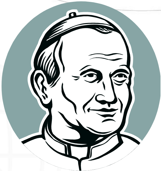
John Paul II

Sin embargo, por la figura que más se recuerda a la Iglesia católica en el siglo XX es por el pontificado de Juan Pablo II. Este Papa polaco rompió con la tradición de cinco siglos de Papas italianos.